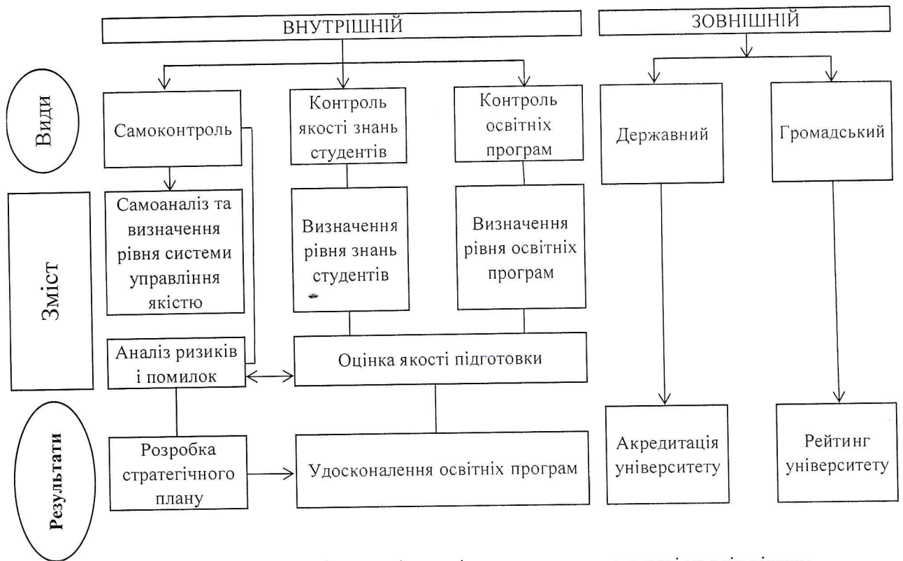
Схема внутрішнього і зовнішнього контролю

Гармонійне поєднання зовнішнього і внутрішнього контролю якості на всіх рівнях: